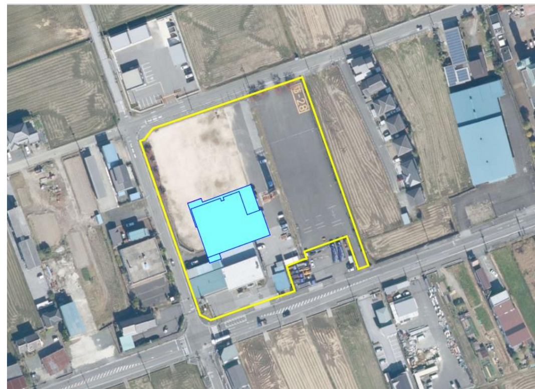
(庁舎配置イメージ)